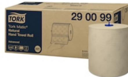
Tork Matic Natural HTR Adv 2p 150m 290099