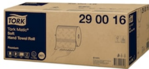
Tork Matic Soft HTR Prem 2p 100m 290016