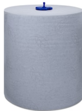
Tork Matic Blue HTR Adv 2p 150m 290068