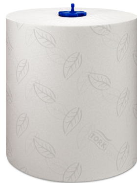
Tork Matic HTR Adv 2p 150m 120067